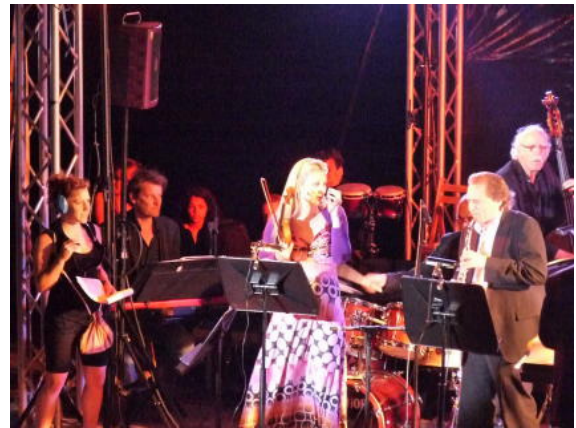
Het concert in volle gang