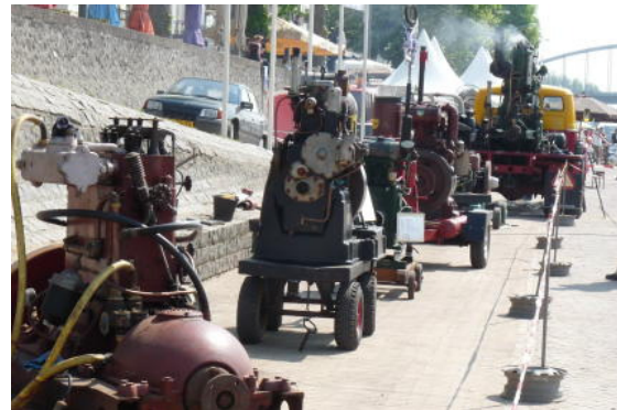
Oude motoren en veel rook!

De Kadedagen 2011 op 23 en 24 april: deze stonden dit jaar ook in het kader van de ASM. Er waren 33 schepen waaronder de nog werkende baggermolen Friesland met een 1-cilinder stoommachine (hiervan zijn er vele op de werf gebouwd), de voormalige houten mijnveger Mahu waarvan er ook 5 op de werf gebouwd zijn, een 5-tal sleepboten die op de werf gemaakt zijn en verder veel meer en minder historische schepen. Door het prachtige weer waren de dagen weer een groot succes met meer dan 8000 bezoekers. Speciaal voor de kadedagen is een boekje gemaakt met het programma, praktische zaken als wc's, de rondvaarten en welke schepen kan ik op, de demonstraties en per schip een klein verhaaltje onder het motto: door wat meer achtergrond informatie te geven zie je meer!