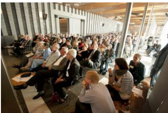
Impressie van de presentatie van het boek in het provinciehuis

Het ASM-evenement is achter de rug. In het Historisch Museum duurt de tentoonstelling nog tot 30 oktober en in de bibliotheek staat nog tot na de zomer het model van de Lauro Sodr , het boek en de film zijn nog te koop maar alle overige activiteiten zijn voorbij. We kunnen spreken van een geslaagd evenement. Niet alleen door het goede weer en de grote opkomst bij de verschillende delen maar ook door de kwalitatief hoge prestaties die er geleverd zijn. Tientallen vrijwilligers hebben zich hier voor ingezet, duizenden toeschouwers hebben er van genoten, allemaal uit liefde voor de voormalige werf, de schepen, de rivier en de stad. Hieronder per deel een evaluatie: