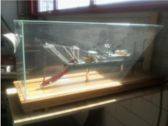
Een van de modellen van een op de ASM gebouwde baggermolen

De tentoonstellingen: in het Historisch Museum Arnhem is van 8 april tot 30 oktober 2011 een tentoonstelling over de werf met bijzondere stukken uit het familie-archief van de familie Prins, modellen en halfmodellen uit het Maritiem Museum uit Rotterdam en stukken van particulieren.