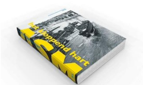
Het boek waar het allemaal om draaide: Het Kloppend Hart

Het ASM-evenement is achter de rug. In het Historisch Museum duurt de tentoonstelling nog tot 30 oktober en in de bibliotheek staat nog tot na de zomer het model van de Lauro Sodr , het boek en de film zijn nog te koop maar alle overige activiteiten zijn voorbij. We kunnen spreken van een geslaagd evenement. Niet alleen door het goede weer en de grote opkomst bij de verschillende delen maar ook door de kwalitatief hoge prestaties die er geleverd zijn. Tientallen vrijwilligers hebben zich hier voor ingezet, duizenden toeschouwers hebben er van genoten, allemaal uit liefde voor de voormalige werf, de schepen, de rivier en de stad. Hieronder per deel een evaluatie: