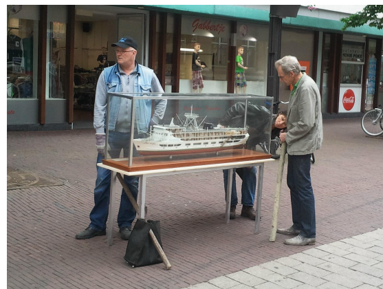
Publiciteit: transport van een model van stadhuis naar bibliotheek

meer dan 200 aanwezigen waaronder veel voormalige medewerkers van de werf en de voltallige familie Prins. De in het boek geportretteerde medewerkers kregen als eerste een exemplaar aangeboden. Verder werd er een woordje gesproken door oa Dolly Verhoeven namens de redactiecommissie Historische Publicaties, Wouter Botman van Boekschap, Jan Prins namens de familie en Steven Gerritsen namens de initiatiefgroep van de SHSA. Het boek is te koop bij Boekschap en bij vele (internet-) boekhandels. Het kent 4 hoofdonderwerpen: opkomst en ondergang van de werf, ook in landelijk perspectief, de geschiedenis van de familie Prins, de schepen en machines die op de werf gebouwd zijn en de ontwikkeling van het ASM-terrein toen en nu. Daarnaast zijn er een 8-tal portretten van ex ASM-ers uit de verschillende afdelingen van de voormalige werf.