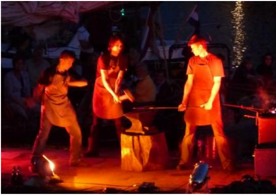
Live klinken met ritmische voorhamers

Al met al kunnen we spreken van geslaagde dagen.