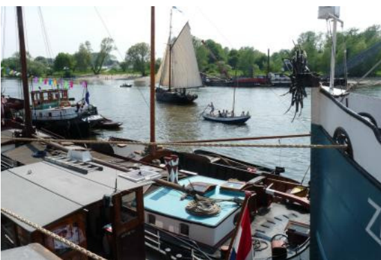
Schepen en nog eens schepen

Daarnaast was er voor de grotere stukken (oa. Machine nr 1 die in het Zwaantje gestaan heeft, gewicht 5 ton!) een tentoonstelling bij Scheepsbouwer Helldörfer aan de Nieuwe Havenweg in Arnhem. Hier waren ook 1:1 reproducties van tekeningen van diverse schepen te zien, een compound stoommachine uit een baggermolen (6 ton), een stoomketel (16 ton), 3 modellen uit het Baggermuseum uit Sliedrecht, een model van de Passaat, halfmodellen, originele scheepsborden van de ASM etc. De tentoonstelling is open geweest op 5 weekenden vanaf 17 april t/m 15 mei. Doordeweeks zijn er 3 lezingen gehouden door Gerard van Gelswijck van het Museum 't Kromhout in Amsterdam (overgang stoom naar diesel), Geert Visser en Thor Smits (de Arnhemse kade toen en in de toekomst) en Wiel Toussaint (de ontwikkeling van de stoommachine ahv oa de aanwezige machines). Tijdens de kadedagen gingen er 2 sleepboten als rondvaartboot af en aan naar de tentoonstelling. Uiteindelijk werd de tentoonstelling goed bezocht, in de weekenden door +/- 30 mensen per dag, tijdens de kadedagen door honderden mensen en bij de lezingen waren gemiddeld 30 mensen.