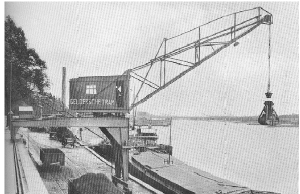
De kadekraan met een poot op onder- en op de bovenkade.

De organisatie van de kadedagen is weer gestart. De kade is gereserveerd, de subsidies zijn aangevraagd. Bij de Goudse havendagen is contact gelegd met enkele laad- en losschepen. Deze schepen geven demonstraties laden en lossen en worden veel gevraagd bij kade- en havendagen. We hopen dat ze dit jaar ook in Arnhem kunnen komen. We proberen de sterke punten van de kadedagen, nl de demonstraties scheepsbouw en scheepvaart verder uit te bouwen. Er is straks weer veel te zien op de kade.