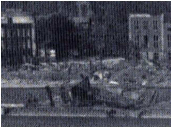
Arnhem 1945: op de voorgrond de verwoeste kadekraan.

maar voor het provinciehuis. Deze is in de oorlog verwoest.