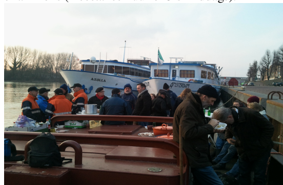
Nieuwjaarsbijeenkomst met vrijwilligers

Misschien wist u het al maar de laatste in Arnhem voor Goedkoop gebouwde havensloopboot Anders J Goedkoop is nu in bezit van de Stichting Anders J Goedkoop. Het is gelukt! Het schip ligt meestal aan de Rijnkade op de plek voor historische schepen. Iedere 2 e zaterdag van de maand is er een klusdag en de gemiddelde opkomst is tussen de 6 en 10 mensen. Er wordt hard gewerkt aan zowel de motor en alle mechanische onderdelen als aan het schilderwerk van het hele schip. We hopen het schip in het voorjaar weer vaarklaar te hebben. Bent u geïnteresseerd om mee te helpen of wilt u gewoon het schip eens zien kom een keer langs op een klusdag. De volgende is op zaterdag 9 maart. Start meestal rond 9 uur tot zolang er animo is (meestal een uur of 3 s' middags).