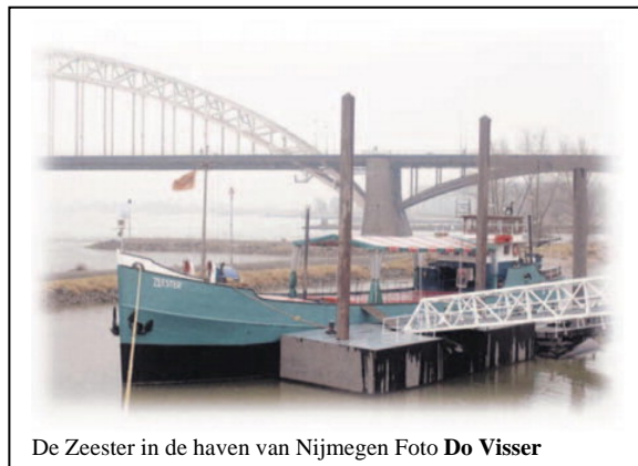
De Zeester in de haven van Nijmegen