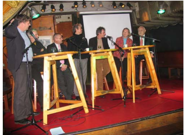
Het debat ab de Zeester