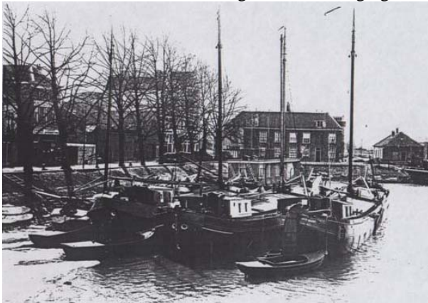
een verdwenen stukje Arnhem

In de vorige nieuwsbrief kon u al lezen dat de Stichting samen met de schippers aan het werken is aan een echt Rijnfestijn. Het huidige Rijnfestijn wordt vooral gedomineerd door het Living Status evenement. Bij een echt Rijnfestijn zou de nadruk moeten liggen op de relatie van Arnhem met de rivier, vroeger en nu. Een dag of enkele dagen voor alle Arnhemmers om (hernieuwd) kennis te maken met heden en verleden van de kade en de rivier. De organisatie van de eerste versie van deze “Arnhemse Kadedagen” is al flink op streek. Een flink stuk kade is gereserveerd. De Zeester (theaterschip) en Rust Roest (oude motoren) zijn al besproken. Op de kade komen demonstraties met klinken, hout krom branden ed. We hopen dat dit een jaarlijks evenement zal worden wat zal meehelpen de band tussen Arnhem en de rivier te versterken. Binnenkort ontvangt u een uitnodiging.