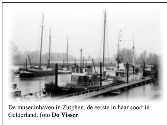
De museumhaven in Zutphen, de eerste in haar soort in Gelderland.