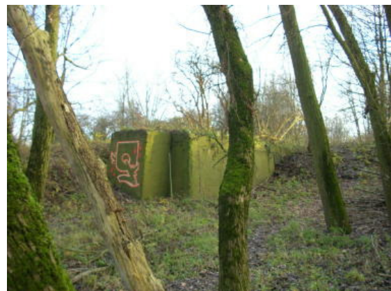
de resten van de fundering van de eerste kraan van de ASM

De gemeenteraad zal dit najaar een besluit nemen.