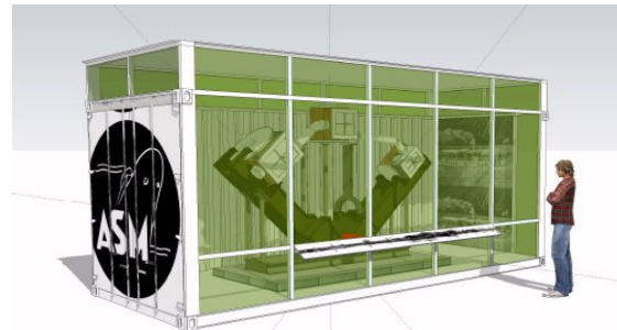
Container voor Stoommachine nr 1 anno 1888

Tijdens de ASM-manifestatie heeft Machine nr 1, de diagonale triple expansie Machine uit 1888, de uitvinding van J.A.Prins waar de ASM-werf mee begonnen is, tentoongesteld gestaan bij Casper Helldörfer. Deze machine staat daar nog steeds en we zijn een aktie gestart om te proberen de machine in Arnhem te houden. Dit is echt een stukje historisch erfgoed van Arnhem. Zowel het Kromhoutmuseum uit Amsterdam (waar de machine de laatste tijd heeft gestaan) als de gemeente Arnhem zijn van mening dat ze in Arnhem moet blijven.