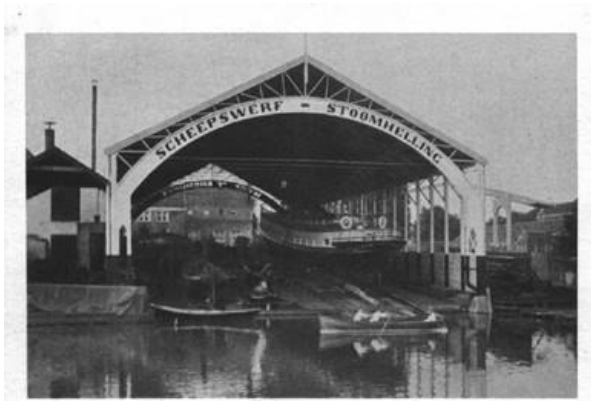
De Werf „t Kromhout” met de nieuwe overkapping en stoomhelling van 1888.

Kees van't Hoff heeft een werkgroep om zich heen geformeerd die hard werkt aan een plan voor een werk-leerwerf op het voormalige ASM-terrein: een helling met werkplaats waar aan oude schepen gewerkt kan worden. Ook wordt gedacht aan een klein museum waar de vele artefacten van de oude werf die nog her en der bij particulieren thuis liggen aan een breder publiek getoond kunnen worden. Bij de klankbord-bijeenkomsten over Stadsblokken/ Meijnerswijk werd dit idee vol enthousiasme ontvangen. Er is een bezoek gebracht aan het terrein en er blijken nog vele restanten van de oude werf en hellingen aanwezig. Inzet is een plan te ontwikkelen waar zowel de eigenaar (Phanos) als de bewoners van het terrein zich in kunnen vinden en wat straks ook past in de nieuwe plannen voor het gebied of deze in ieder geval niet in de weg zitten.