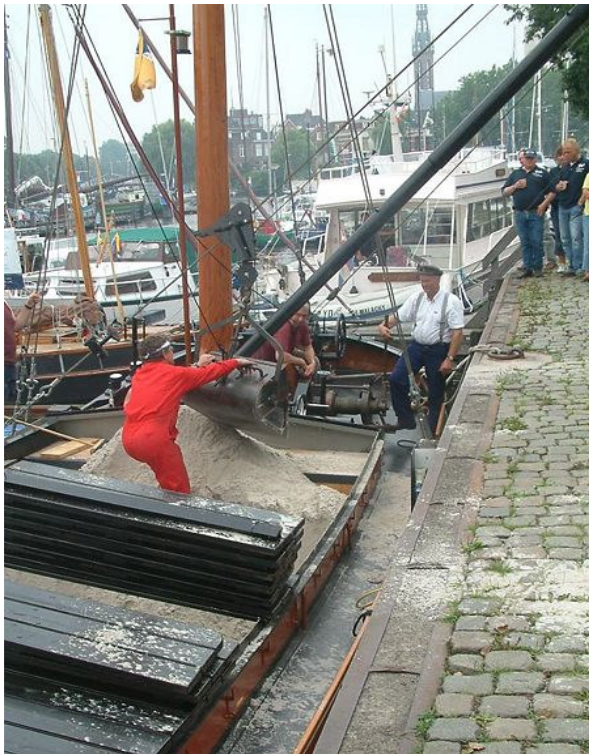
Zand lossen zoals het vroeger ging

De zandschuit “Door Gunst Verkregen” heeft toegezegd op de kadedagen demonstraties zandladen en -lossen te geven. Ze komen inclusief de zandtrechter en oude vrachtwagen.