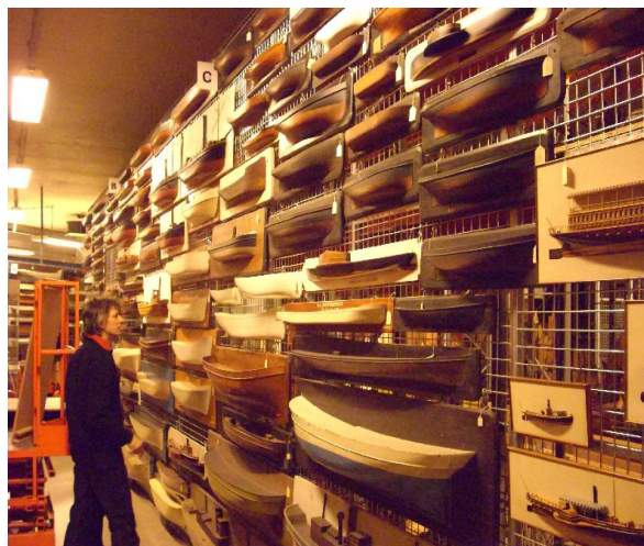
Het depot met halfmodellen in het Maritiem Museum Rotterdam

Hier is veel bruikbaar materiaal bij wat nog nooit aan het publiek getoond is. We gaan proberen subsidie of een sponsor te vinden om een groot gedeelte te scannen en dmv de dvd zichtbaar te maken aan een groter publiek.