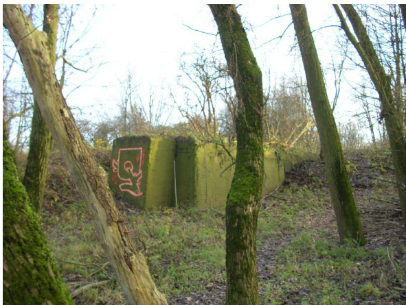
Het fundament van de eerste kraan van de ASM staat er nog

Kees van't Hoff heeft een werkgroep om zich heen geformeerd die hard werkt aan een plan voor een werk-leerwerf op het voormalige ASM-terrein: een helling met werkplaats waar aan oude schepen gewerkt kan worden. Ook wordt gedacht aan een klein museum waar de vele artefacten van de oude werf die nog her en der bij particulieren thuis liggen aan een breder publiek getoond kunnen worden. Bij de klankbord-bijeenkomsten over Stadsblokken/ Meijnerswijk werd dit idee vol enthousiasme ontvangen. Er is een bezoek gebracht aan het terrein en er blijken nog vele restanten van de oude werf en hellingen aanwezig. Inzet is een plan te ontwikkelen waar zowel de eigenaar (Phanos) als de bewoners van het terrein zich in kunnen vinden en wat straks ook past in de nieuwe plannen voor het gebied of deze in ieder geval niet in de weg zitten.